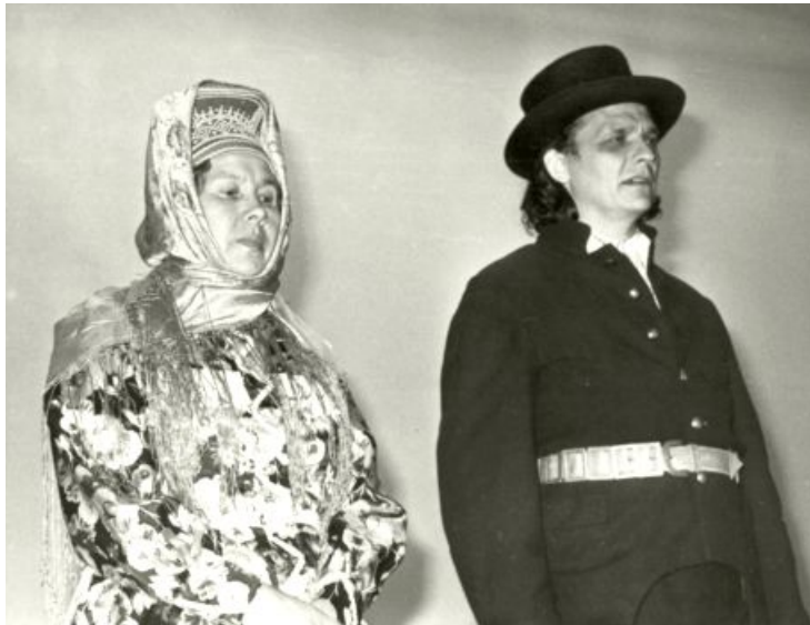
Autorid 1986. aasta oktoobris.