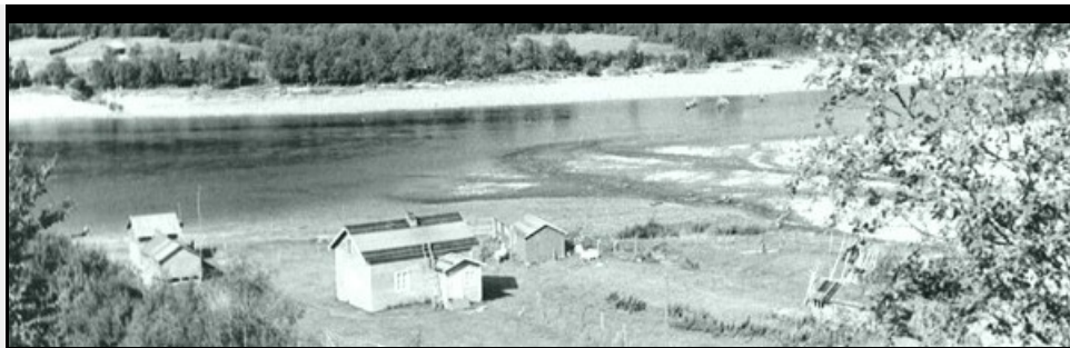
Küla asetseb Teno jõe ja tundruala vahelisel rannaribal. Pildil on Vuolabi maja. (TKU/P/67/52.)

Uurimused, milles on põhjalikult käsitletud uskumustraditsiooni teatud ajaliselt ja paikkondlikult piiratud kollektiivis toimiva süsteemina, on folkloristikas siiani haruldased. Sedalaadi töid tuleb otsida eeskätt kultuurantropoloogiast või antropoloogiliste sugemetega folkloristikast.