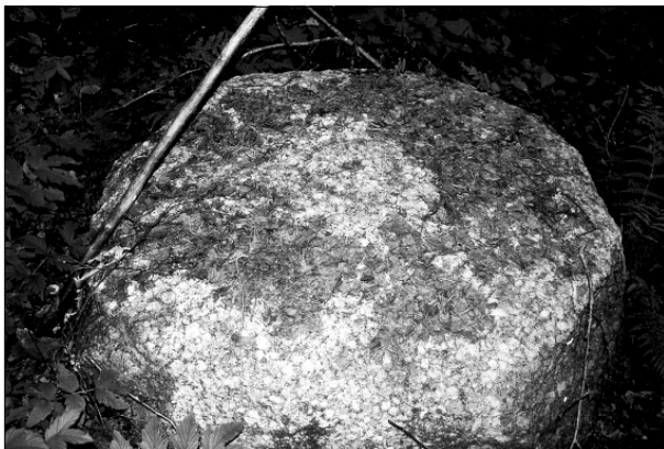
Joonis 1. Punktiga ring kivil Virunuka tarandkalmete läheduses Rõuge kihelkonnas. Kohalik rahvas peab piirikiviks. Alkeemias tähistab selline sümbol kulda. Miks sellel kivil leidub niisugune sümbol, ei tea.