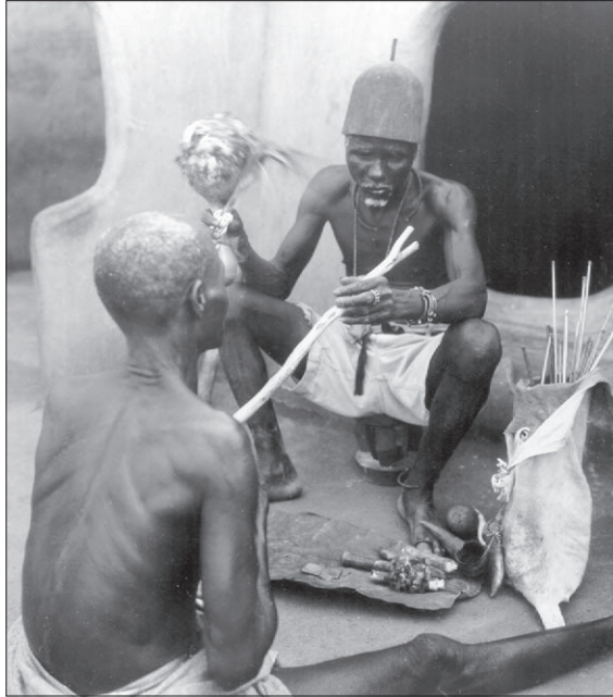
Joonis 3. Ennustaja (baano) küsitlemine. Ennustaja kutsub pudelkõrvitsast kõristi abil välja oma kaitsevaimu (jadok). See vaim annab ennustaja vasakus käes oleva kaheharulise kepi kaudu kliendile (pildil seljaga vaataja poole) teada, millistele üleloomulikele olenditele ta peab joogi- ja söögihvleid tooma.

lapse jutust tehtavad järeldused: meie argieetika koos oma põhimõttega ise jõude olles mitte kaasinimesi töötada lasta või ammugi mitte teistel enda heaks töötada lasta – see põhimõte tühistatakse, kui seda nõuavad maagilis-religioossete eeskirjade respektierimisest (tabudest) tulenevad kõrgema astme käsud.