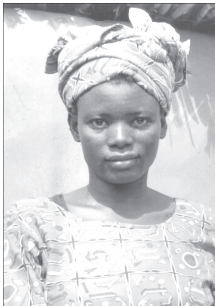
Joonis 1. Noor bulsa naine.

Jutus BUL-E0403 elas naine talundis koos poja ja veel kahe naisega. Need naised olid nõiad. Nõiad käisid alatasa väljas, et endale inimliha hankida – inimsööjaks olemine on üks nõidade iseärasusi. Kui nad inimlihaga koju naasid, andsid nad alati sellest veidi ka kolmandale. Ühel päeval ütlesid nad, et nemad on juba iga päev väljas inimliha toomas käinud ja alati midagi ka temale andnud, nüüd tahavad nad ükskord ka temalt inimliha saada. Naine ei teadnud, kust ja kuidas ta saaks nõidadele inimliha hankida. Oma nõutuses haaras ta poja ja tappis nõidadele toiduks. Mõne päeva pärast tuli poeg vaimuna tagasi, läks oma ema talundiossa, tõi välja trummi, istus maja ette ja alustas siis, kui inimesed surnut itkema tulid, oma leinalaulu: “Kellelgi pole vaja minu pärast itkeda, sest minu oma ema tappis mu nõidadele, ma ei ole surnud jumala tahtel.” 48