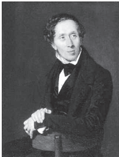
Joonis 3. C.A. Jensen. Hans Christian Anderseni portree. 1836.