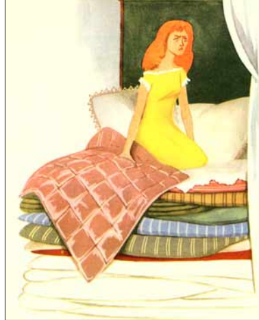
Joonis 4. Maret Kernumehe illustratsioon Hans Christian Anderseni muinasjutule Printsess hernel. Raamat Kaks muinasjuttu, Tallinn 1964.

Printsess tänas kuningannat ning ronis üles, kuni jõudis ülemise madratsini. Ta tõmbas endale teki peale ja sulges silmad.