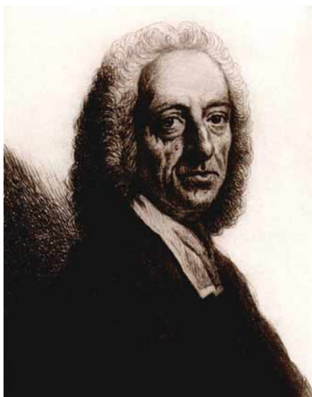
William Whiston (1667–1752).

W. Whiston esines R. Boyle'i loengute sarjas aastal 1707. Tema kaastöö sellele suurejoonelisele projektile avaldati pealkirja Pühakirja prohvetearingute täidmine