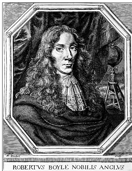
Robert Boyle (1627–1691).

W. Whistoni mõtlemine on heaks näiteks sellest, mida on nimetatud njuutonliku teadu-