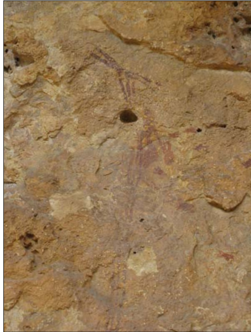
Joonis 2. Neoliitiline meekorjaja kujutis Cueva de la Araña leiukoha kaljul Hispaanias.

tust V. Poikalaineni fotodest ja raiendikopeeringutest, mis ta oli teinud 2005. ja 2006. aasta Äänisjärve-ekspeditsioonil. L. Jõekalda võitis peaauhinna Kaunases rahvusvahelise graafikabiennaali raames näitusega “Kiviaja graafika”, mis koosnes Karjala ja Koola kaljujooniste fotodest ja joonisekopeeringutest.