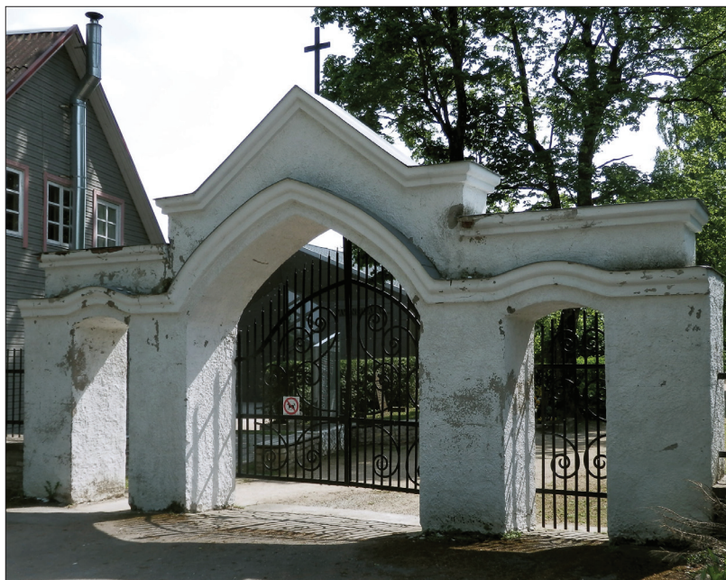
Foto 5. Rakvere linnakalmistu peavärv.

Kalmistu maa-ala visuaalseks sulgemiseks rajati 1993. aastal matuseala lõunapiirile Rahu tänava äärde uus metallvarbadest ja paekivist postidega aed. Läbipääsuavad on suletud metallväravatega. Sarnane aed piirab ka surnuaia põhjakülge, idakülg on piiratud hoonete välisseintega, võrkpiirde ja puitaiaga, aga läänekülge moodustab looduslik mäenõlv.