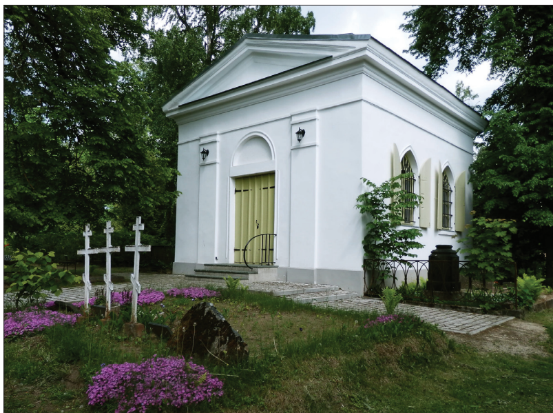
Foto 2. Õigeusu kabel, rajatud 1849. aastal. Tiina Tuuliku foto 2013.

Nõukogude võimu aastail peeti kabelis matusetalitusi, nii kristlikke kui ka ilmalikke (Kirss 2006).