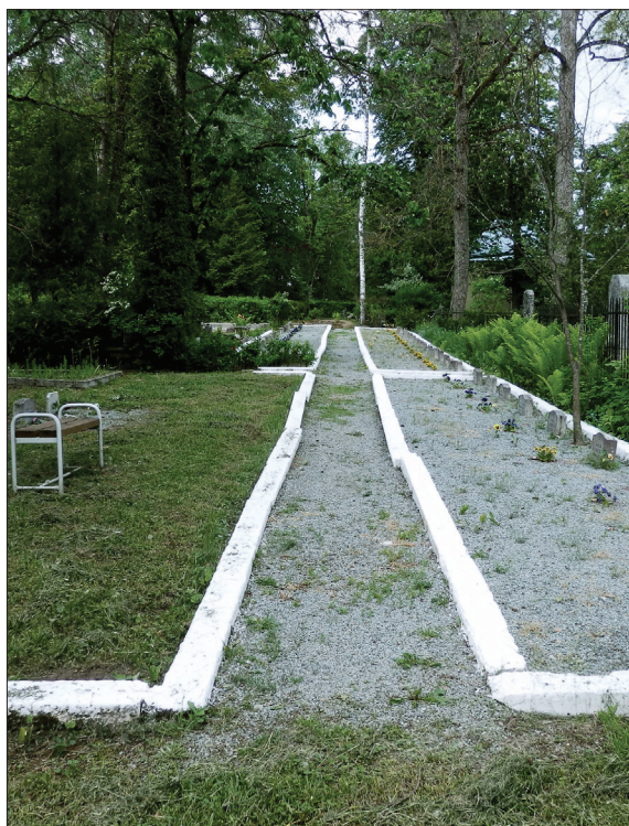
Foto 9. Nõukogude sõdurite matuseala.