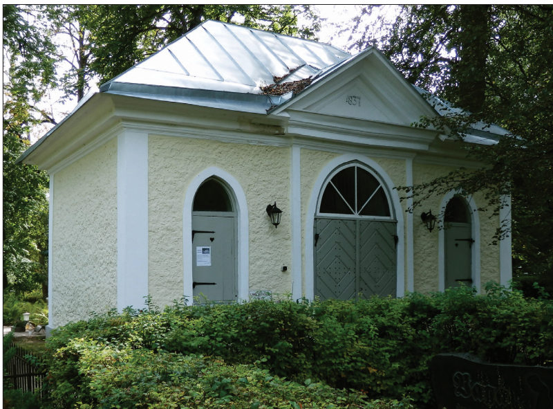
Foto 1. Kabel “saksa” kalmistu lõunaserval, rajatud 1936. aastal. Tiina Tuuliku foto 2013.

1836. aastal ehitati “saksa” kalmistu lõunaservale kivikabel. Oma praeguse kuju sai see 1939. aastal (Kirss 2006). 20. sajandi teisel poolel kaotas ehitis oma esialgse otstarbe ja oli kasutuses tööriistakuurina (samas). “Saksa” kabel sai oma praeguse nägusa väljanägemise 2008. aastal, mil viidi läbi ulatuslikud restaureerimistööd.