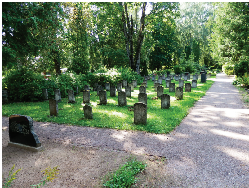
Foto 8. Eesti kaitseväe kalmistu, õnnistatud 1933. aastal.