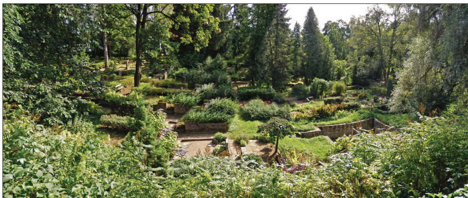
Foto 6. Vaade õigeusu kalmistu laienduse serval asuvalt nõlvalt alla 20. sajandi laiendusele.

Kalmistu peatee, mille alguses on valgeks krohvitud uhkete sepiväravatega sissepääs, paikneb 6 m kõrgemal kui Rahu tänava poolses otsas asuv metallvärav. See maastikuline omapära lisab pidulikkust kogu surnuaiale, avades vaateid nii ülevalt alla kui ka vastupidi.