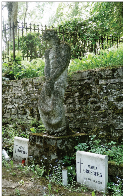
Foto 4. Skulptuur “Ecce homo”, autor Voldemar Mellik, valmis 1939. aastal.

Eesti iseseisvuse ajal vähenes suur- tööstuse osakaal, mistõttu aeglustus ka linnarahvastiku kasv. 1922. aastal elas Rakveres 7660 inimest, 1941. aastaks oli linna rahvaarv suurenenud 10 847 elanikuni, 91%