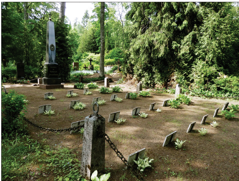
Foto 7. Tuletõrjeseltsi rahula, mälestusmärk 1912. aastast.

Kõige rohkem on sõjaväekalmistul Vabadussõjas langenute ja Eesti Vabariigi päevil Rakveres paiknenud üksuste sõdurite kalme.