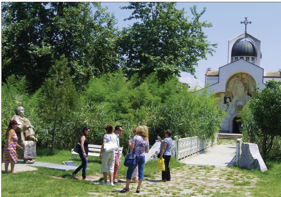
Foto 6. Külastajad Rupites Vanga kuu juures.