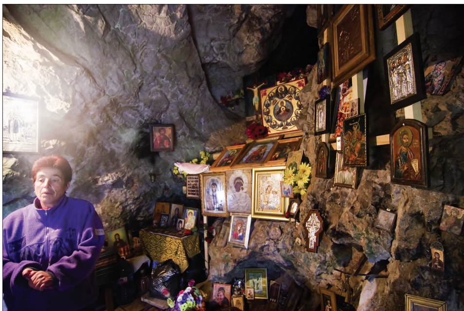
Foto 2. Sv Petka kaljukabel Tranis. Selgitusi jagab üks kabelihoidjatest. Andres Kuperjanovi foto 2014.

Kirjad palvetega ja suuline traditsioon koos pühakukohaste uskumustega on endiselt elavas kasutuses. See moodustab osa sakraalseid paiku käsitle- vast suuremast juttude ning uskumuste korpusest, mis levib nii raamatute, haridussüsteemi, elektroonilise meedia kui ka suulise perepärimuse kaudu.