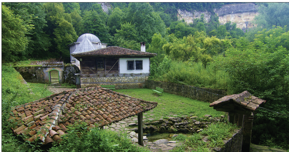
Foto 4. Demir Baba teke. Värava tagant paistab katusealusest pühast kohast väljuv allikas, mausoleumi ees oleva ehitise küljel on kohvimasin ja mausoleumi tagant paistab kaljuastang. Andres Kuperjanovi foto 2014.

Teostasime 2014. aasta juulikuus välitööid 16. sajandil rajatud Demir Baba teke (pühamu) juures, mis asub Sveštari küla läheduses, Ispérihi haldusalas Kirde-Bulgaarias. Valisime vahetult tekele pühendatud kohaliku kultuuriürituse eelse aja. Demir Baba teke kuulub bi-rituaalsete paikade hulka (lähemalt vt pühamu ja praktikate kohta Venedikova & Gergova 2006). Demir Baba teke juurde ei juhata viidad ega vii avalik transport, mis pani meid arvama, et kuulus paik on väljaspool intensiivset turismitööstust. Vaatluspäeval külastasid pühamut erinevad rühmad ja isikud: mõneinimeselised turistide salgad, sõbrad, rändurid, enamasti aga perekonnad. Orus paikneva pühamu juurde võib mäest alla laskuda mitmest küljest, ja kõik teed olid kasutuses. Füüsiliselt