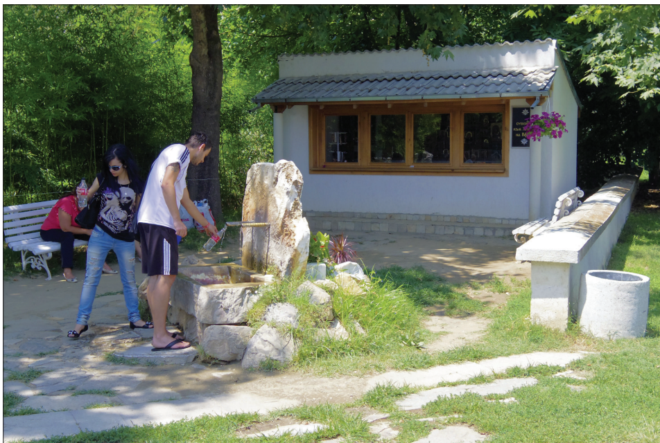
Foto 7. Püha vee kaasavõtmine Rupites, ühest torust tuleb kuumaveeallika ja teisest tavaline vesi.

Püha Petka kirik ehitati Baba Vanga rahalisel toetusel tema valitud kohta 1992. aastal. Mõjukad realistlikus stiilis ja ikoonimaali kaanonitest põikuvad pühapildid valmistas kunstnik Svetlin Rusev. Kaanonist eemaldumine on ka põhjus, miks Bulgaaria Autokefaalne Õigeuskirik pole neid heaks kiitnud. Püha Petka kiriku ja kogu keskuse loomine toimus Vanga ja talle lähedaste isikute koostöös ning paiga struktuur järgib Bulgaaria kloostrikomplekside traditsioone.