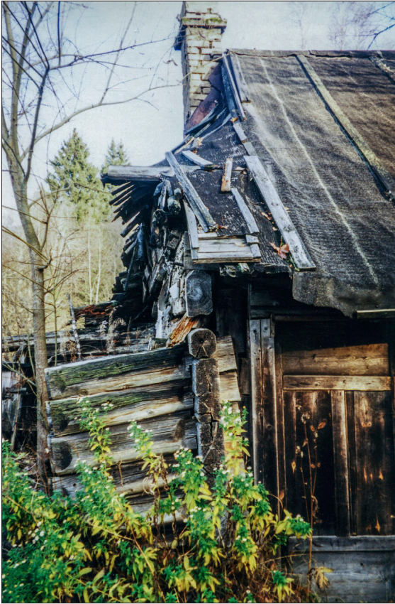
Foto 3. Lagunev Kanarbiku talu Mägede külas, kus elas eraklik meesterahvas, rahva seas tuntud kui "Mõnuvere lumeinimene".

“Minu maastike” lugusid võib mõtestada kui lugusid kohanemisest, juurte kasvatamisest. Piirkondlikult tõusid enim esile Virumaa, seejuures ka Ida-Virumaa paikadest kirjutatud lood. Näiteks kaevanduspiirkonna aherainemägedega seotud lood ja kohanimed, kirjeldused Kohtla-Järve ja Narva linnakeskkondadest, hoonetest ja tänavanimedest.