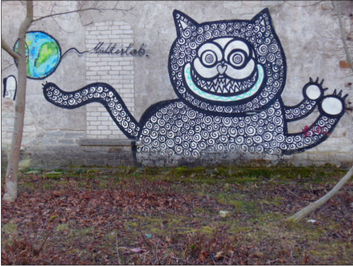
Foto 4. Grafiti Kalamajas: “iga kuu muutub tänavapilt, linnamaastikule ilmub asju, mida seal varem ei olnud”. Tuuli Reinsoo foto 2015.

žürri silmis esile, sest sidusid kollektiivselt olulised ja aktuaalsed lood iseenda vahetu keskkonnakogemusega.