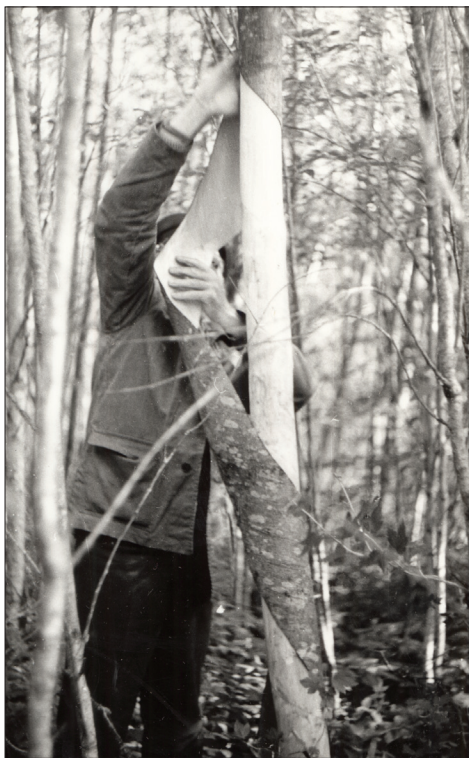
Foto 5. Lepa koorimine karjapasuna valmistamiseks. Simuna khk, Metsküla.