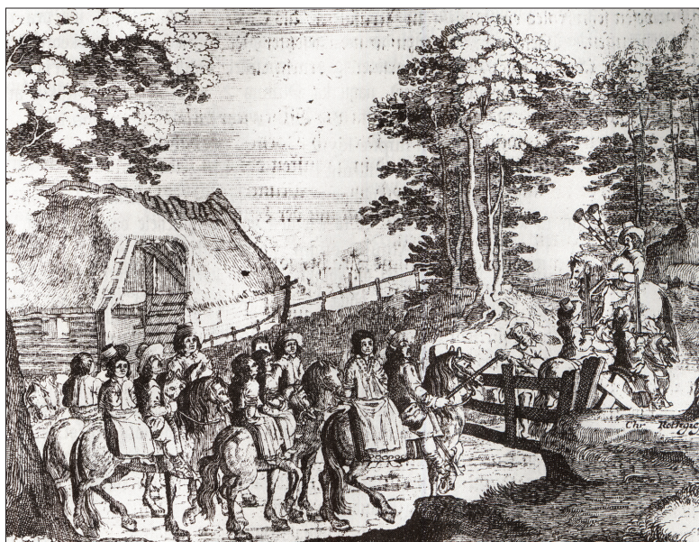
Foto 4. "Ees ratsutab torupillimees." Adam Oleariuse joonistus pulmakirjelduse juurde 17. sajandist.

Torupill. Virumaa territooriumilt pärineb üks vanimaid eesti torupilli ja torupillimängija kujutisi. See on nimelt aastasse 1635 dateeritav pilt “Pulmasõit” Adam Oleariuse reisikirjeldusest (1996: 121). Sellest ajaliselt vanem torupilli-mängija on kujutatud Bernt Notke “Surmatantsus”, kuid selle 15. sajandisse kuuluva teose inimtegelased (seda enam veel luukerena kujutatud torupillimees!) on n-ö etniliselt määramatud ja eri seisustest eurooplased, seevastu Ole-