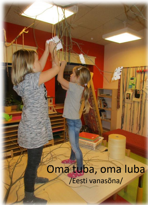
Oma tuba, oma luba /Eesti vanasõna/