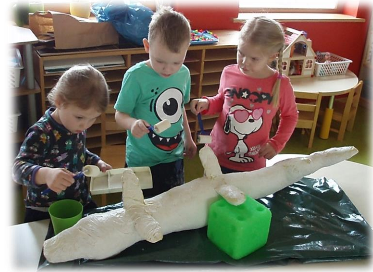
Merekultuuri aasta „Kui heering elas kuival maal“ arengulugu