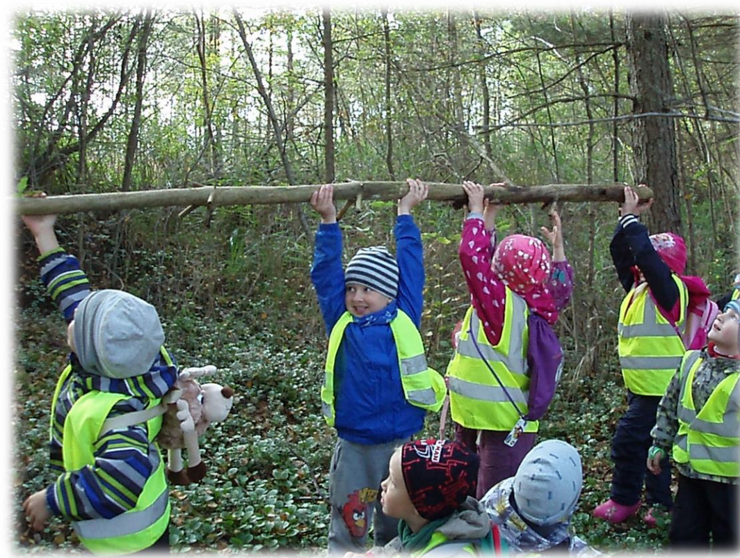
Oleme sipelgad metsas