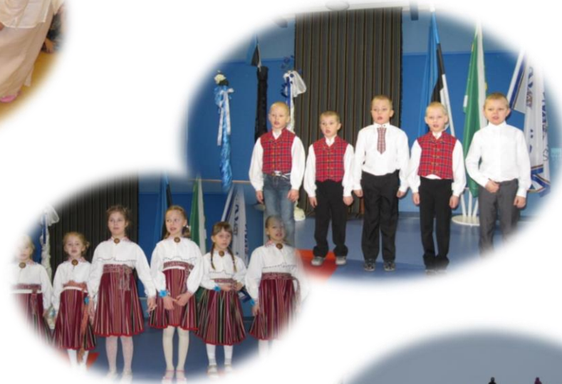
EESTI VABARIIGI AASTAPÄEV