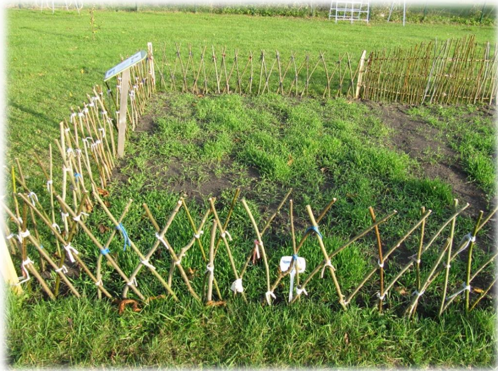
Lapsed ehitavad RUKKIPÕLLU ümber aia