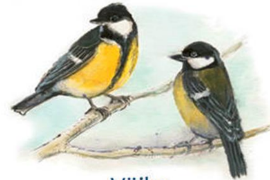
Väike linnuraamat rahvapärimusest