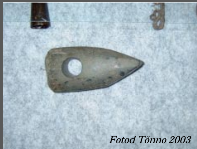
Fotod Tõnno 2003