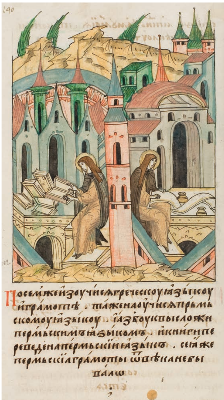
11. Стефан создаёт пермскую азбуку. Лицевой летописный свод XVI в.