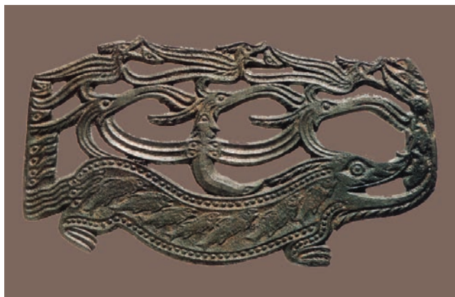
20. Ажурная бляха: человеколоси на ящере, VI–VIII вв. Бронза, литъё. Сборы А.А. Спицына в 1898 г. Д. Нырғында Сарапульского р-на Республики Удмуртия.