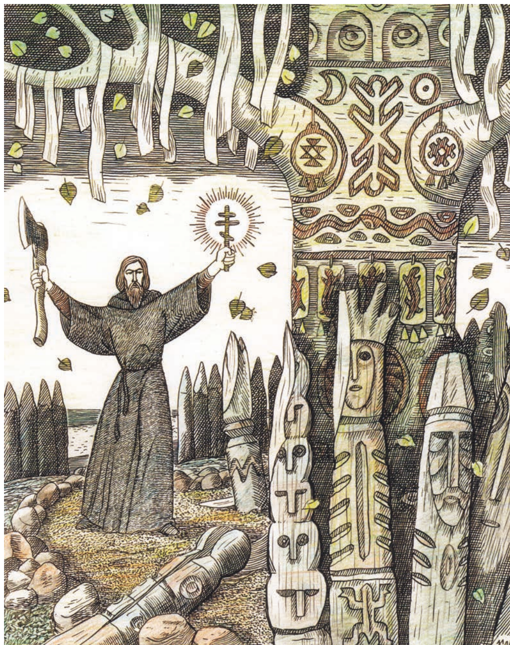
1. Стефан Пермский и «прокудливая береза». Худ. А. В. Мошев.