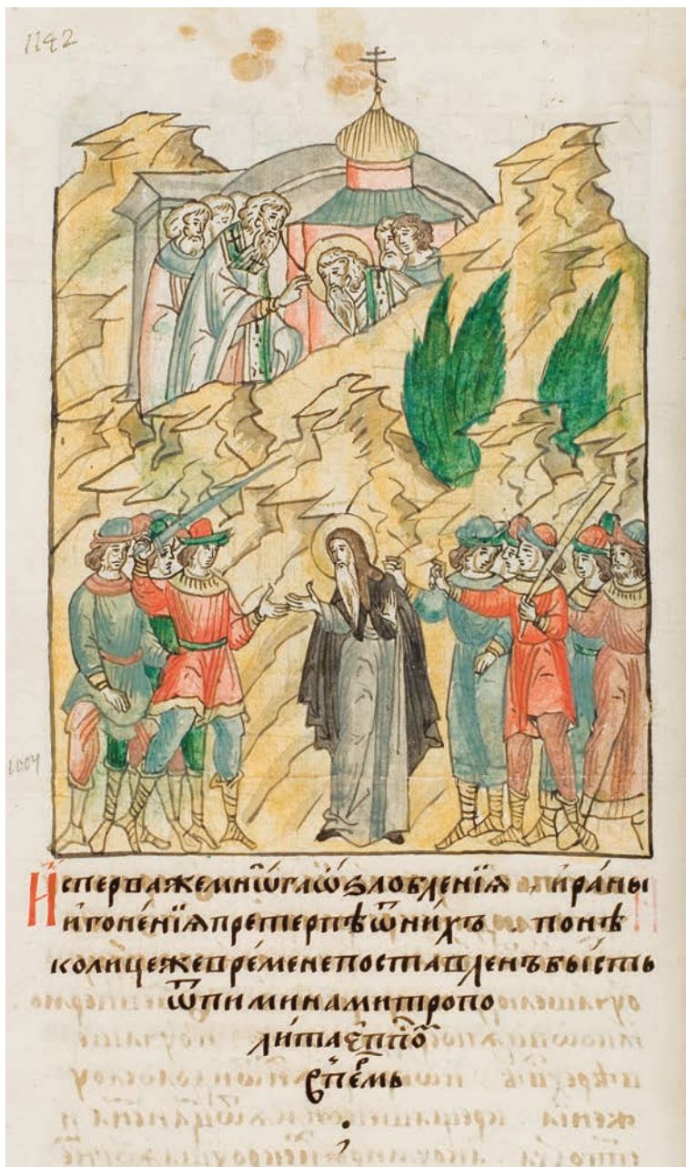
12. Стефан и язычники-пермяне. Лицевой летописный свод XVI в.