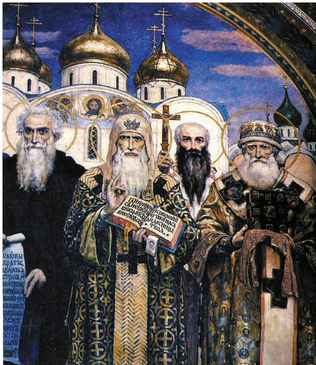
8. В. М. Васнецов. Фрагмент росписи алтарной части собора св. Владимира в г. Киеве. Изображены: преподобный Феодосий Печерский, св. Алексей, митрополит Московский, св. Стефан Пермский, св. Петр, первый митрополит Московский.