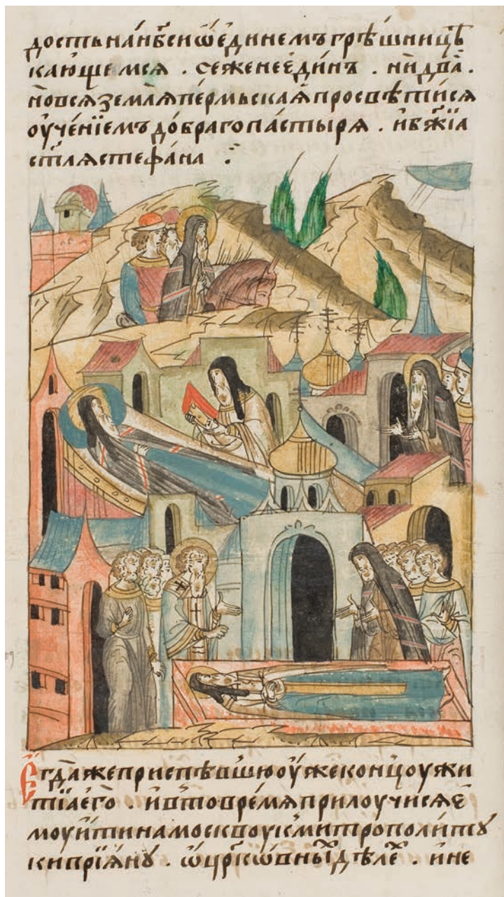
14. Успение Стефана Пермского. Лицевой летописный свод XVI в.