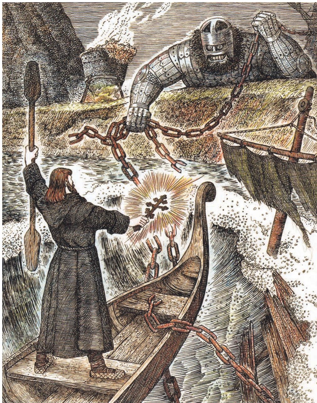
2. Стефан Пермский и тун Кёрт Айка. Худ. А. В. Мошев.