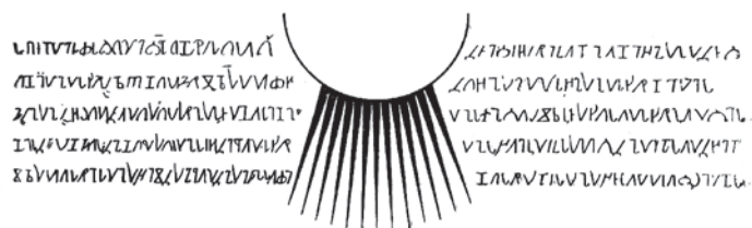
7. Надпись под иконой «Сопествоие Святого Духа» (В. Лыткин 1952: 41).