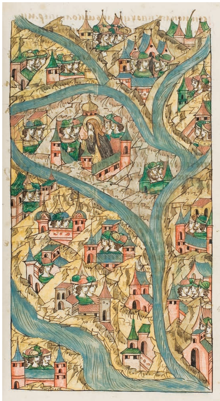
13. Пермская земля. Лицевой летописный свод XVI в.