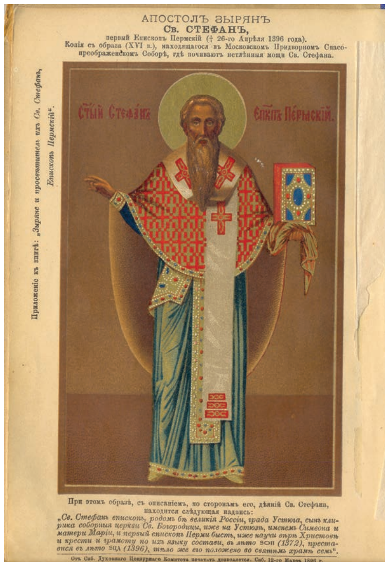
10. Литография из книги А. Красова «Зыряне и св. Стефан, епископ Пермский» (1897).