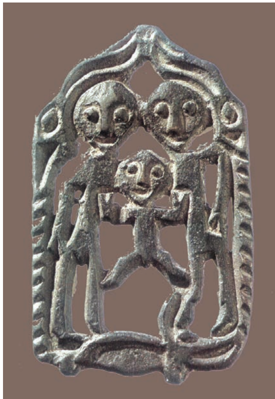
19. Прорезная бляха: родители с ребёнком на ящере под сводом из лосиных голов, VIII–IX вв. Чердынский р-н Пермского края.