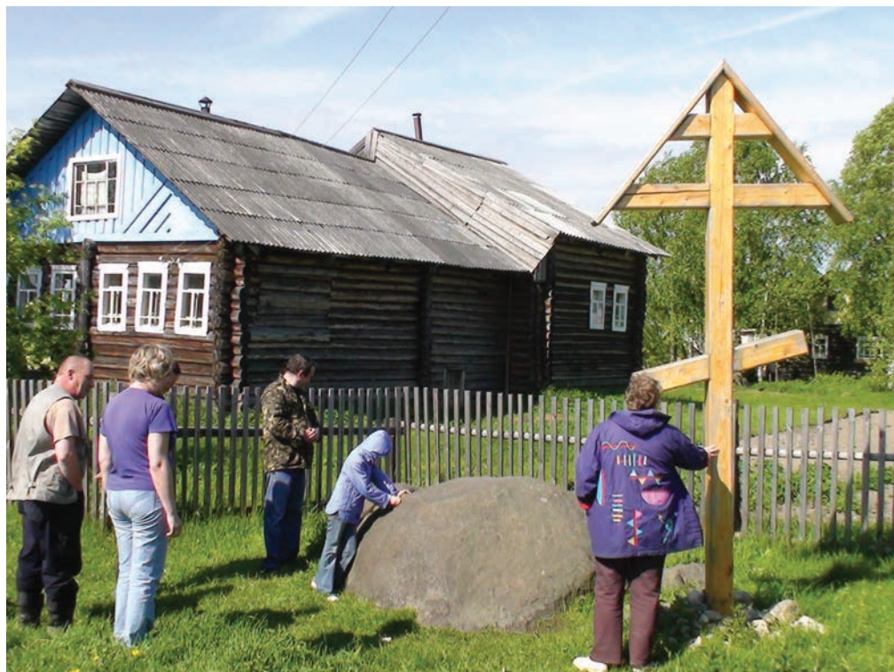
6. Камень, на котором, по легенде, приплыл Стефан Пермский. Д. Эжолты Усть-Вымского р-на, Республика Коми. Фото П. Ф. Лимерова, 2010.