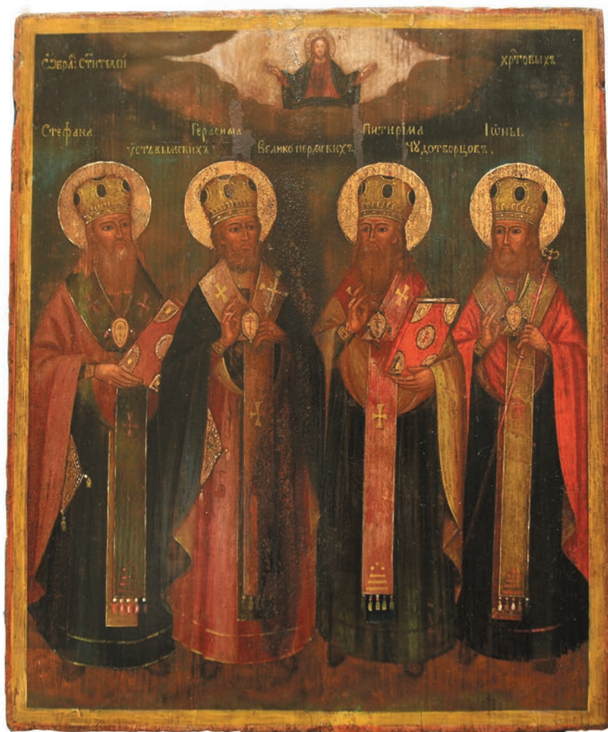
5. Икона «Стефан, Питирим, Герасим и Иона Пермские – Усть-Вымские чудотворцы». Национальный музей Республики Коми.