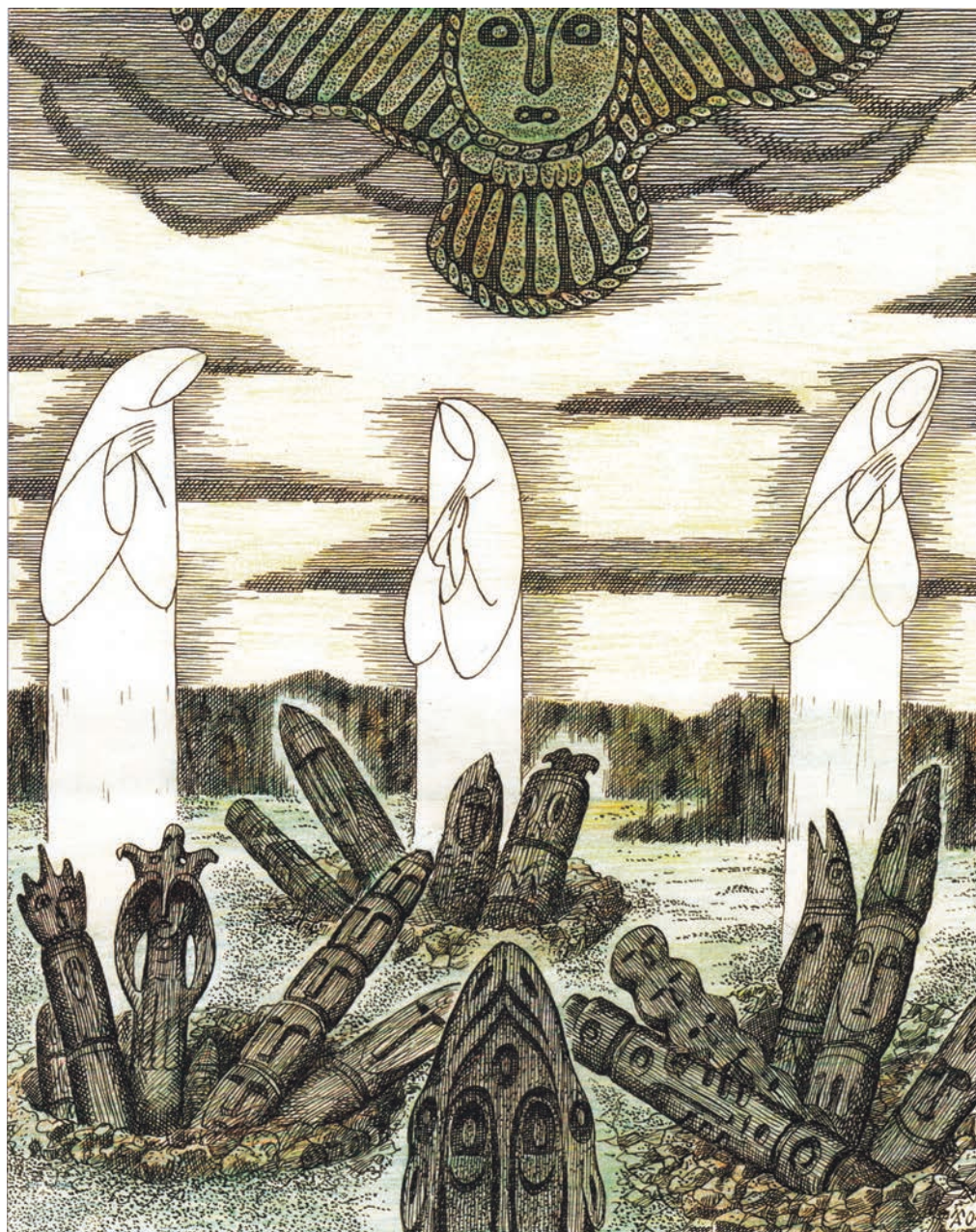
3. Пермские боги уходят. Худ. А. В. Мошев.