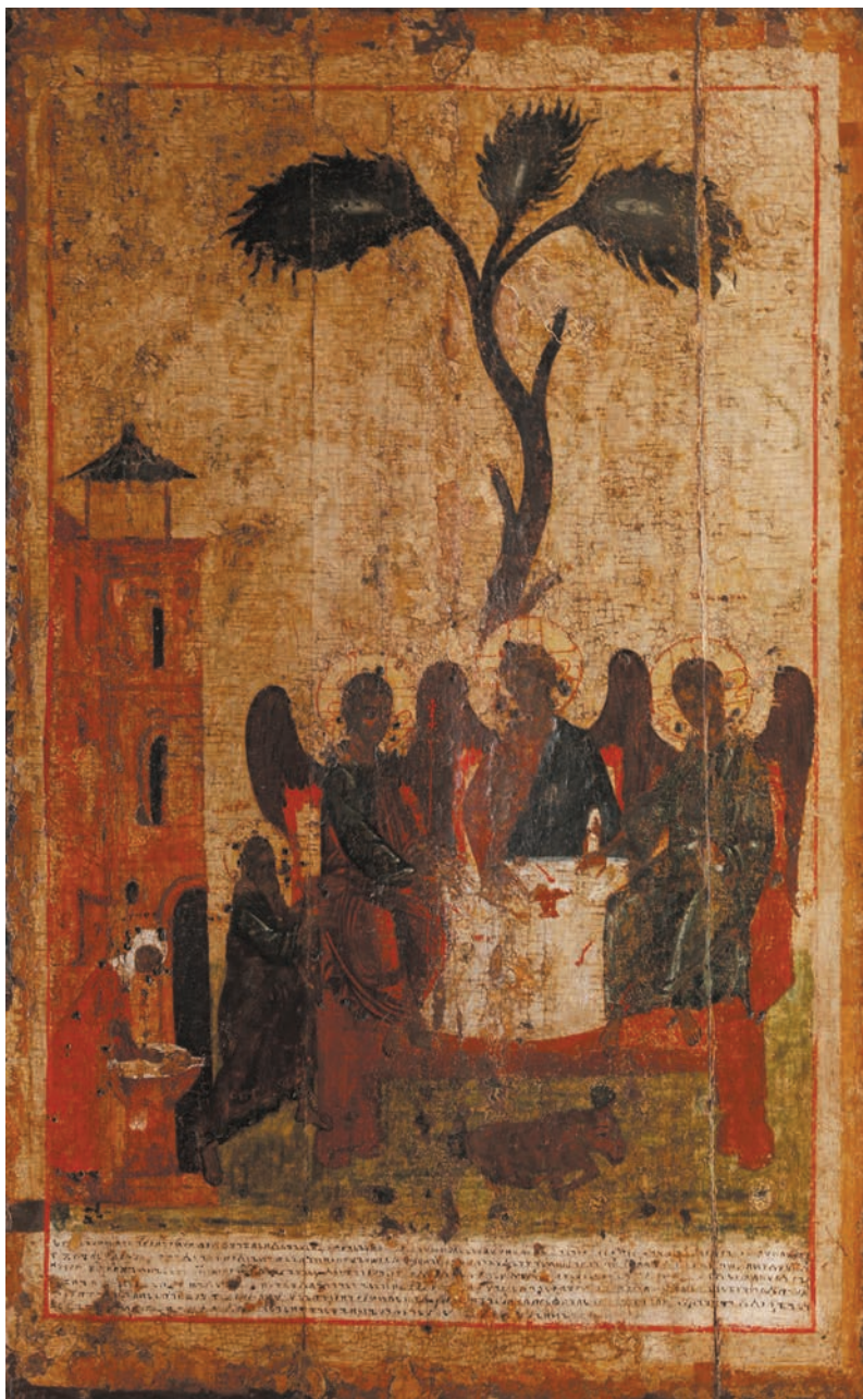
4. Икона «Зырянская Троица», написанная, по преданию, Стефаном Пермским. Вологодский краеведческий музей.