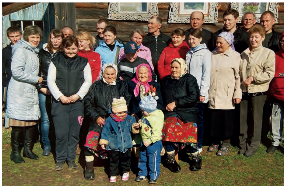
9 куартолэзе митинг бере семьяеныз но выжы-кумыеныз ёш. 2012-тй ар. Вьль Тйгырмен. Никоновёслэн архивыстызы.