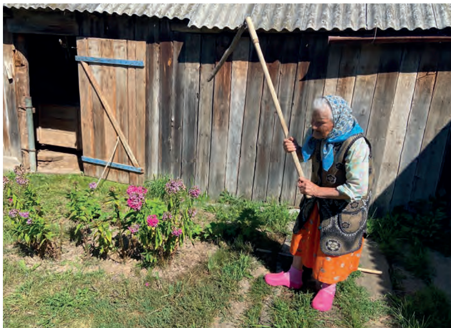
Мария Павловна возматэ, кызы азьвыл арёсы қутсаськызы. 2022-тй ар. Вьль Тйгырмен.