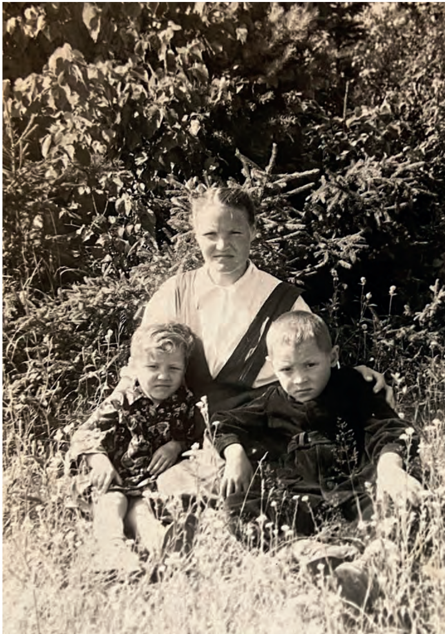
Володя но Роза нылпиосыныз нюлэс дурын. 1958-тй ар. Виль Тйгырмен.