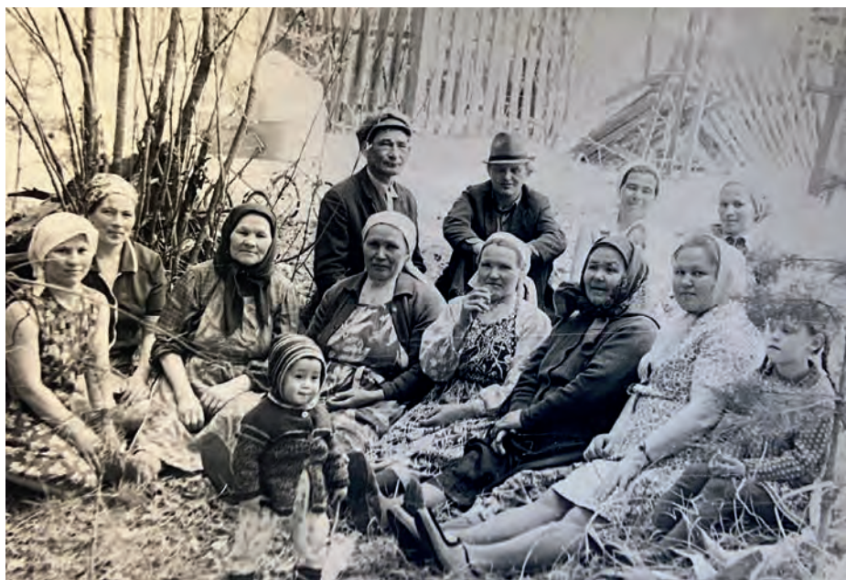
Виль Тйгырмен шай вылын тулыс кисьтон дыръя. 1977-тй ар. Виль Тйгырмен.