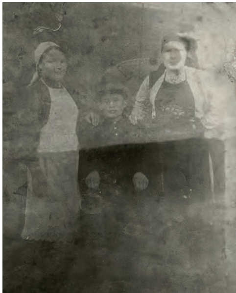
Алнаш ёросысь Кузёбай гуртысь Жакы но Миша эшгёсыныз. 1945-тй ар. Кузёбай.