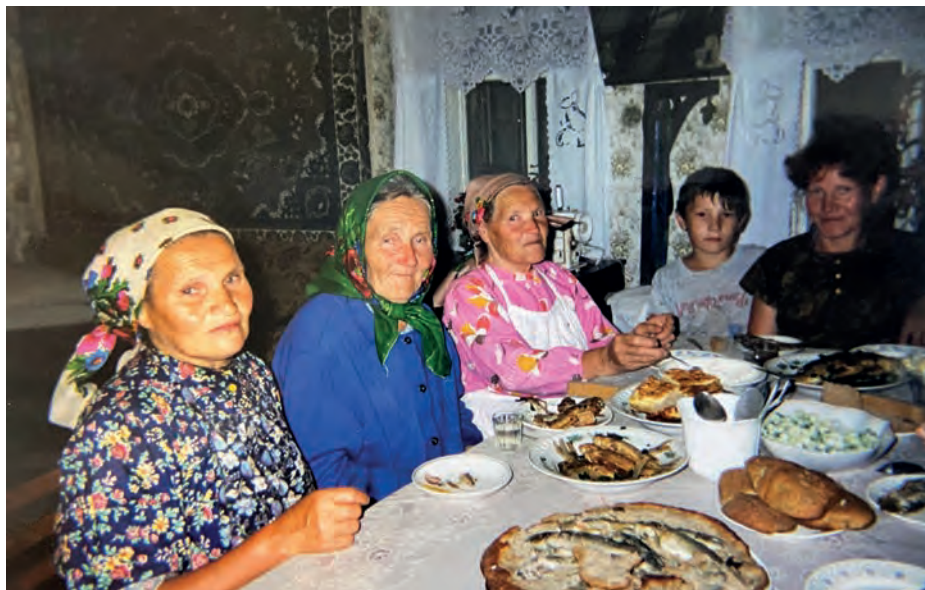
Катя туклячиезлэн вордскем нуналаз. 1999-тй ар. Вьль Тйгырмен.