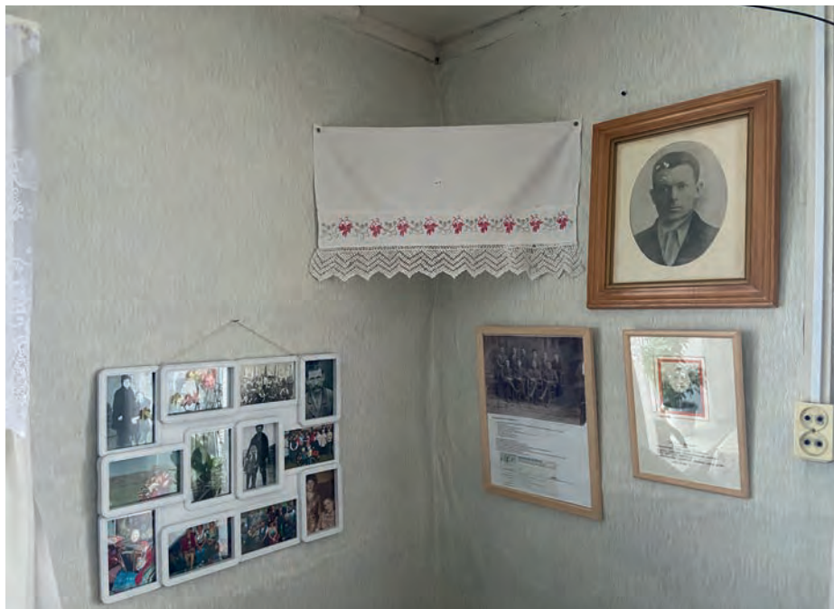
Ожын бырем агайёсызлы но семьяезлы сйзем сэрег. 2022-тй ар. Вьль Тйгырмен.