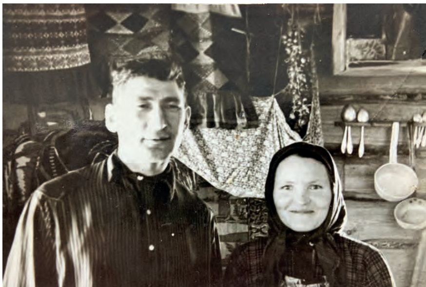
Виктор кузпалэныз. 1967-тй ар. Виль Тйгырмен.