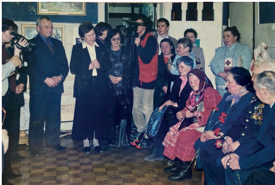
Мария Павловна конференции люкаськем калык азын домброен шудэ. Ижкар.