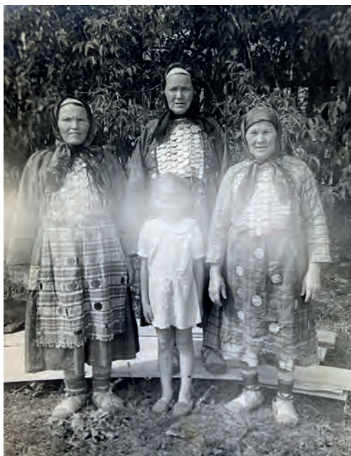
Офнасья апаеныз, Эля нылыныз но Обран кышно Аннаен Вьль Тйгырмен школа дорын. 1975-тй ар. Вьль Тйгырмен.