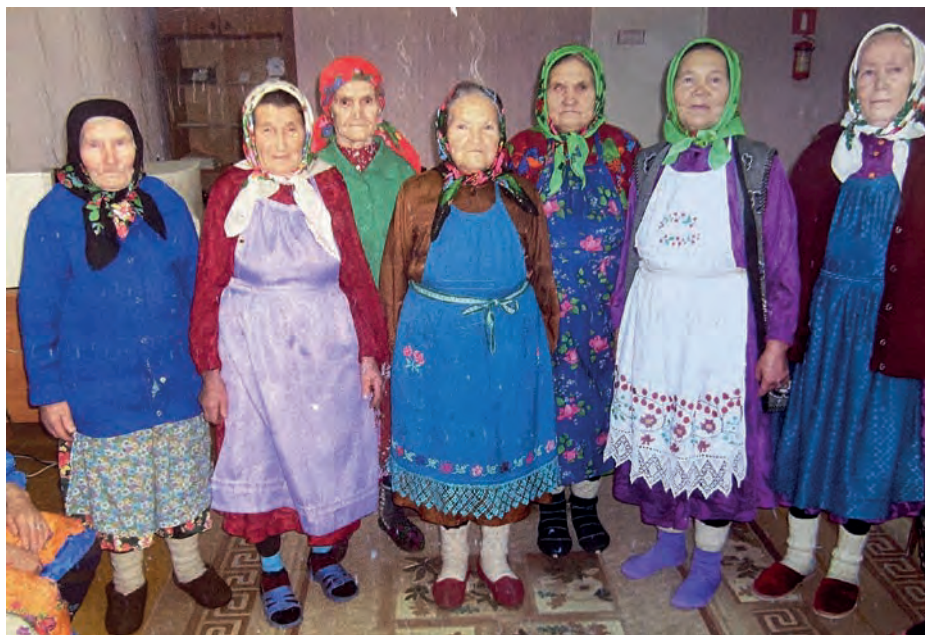
Мария Павловна Вьль Тйгырмен гуртысь арлыдо эшгъёсыныз Киясаысь ЦСО-ын. 2010-тй ар. Кияса. Никоновъёслэн архивысьтызы.