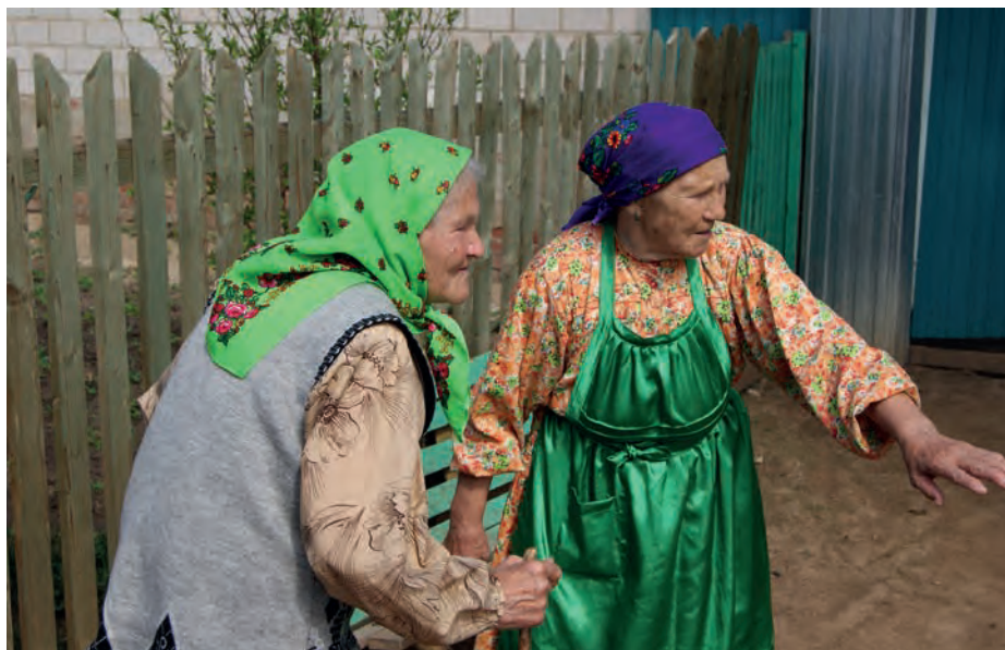
Сюранаезлэн Дарья нылыңыз. Ляли, Алнаш ёрос.