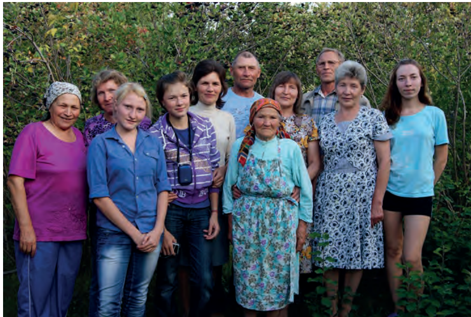
Мария Павловна нылпиосыныз но нунокъёсыныз. Виль Тйгырмен.