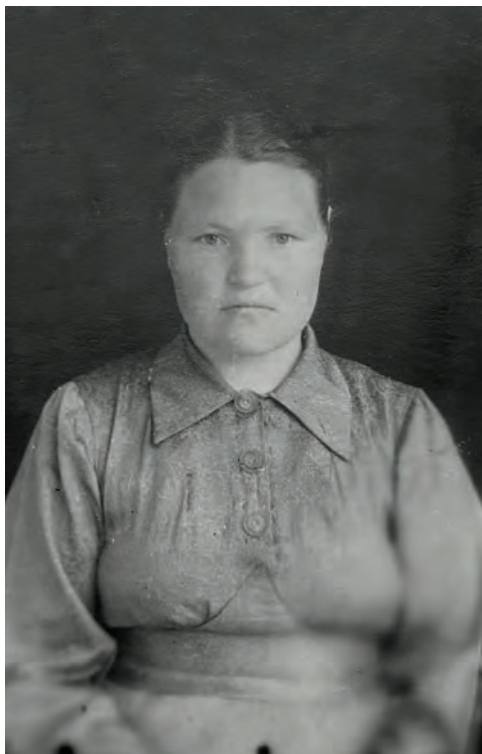
Ижысь педучилищын заочно дышетскон аръёсы. 1951-тй ар. Ижкар. Никоновъёслэн архивысьтызы.