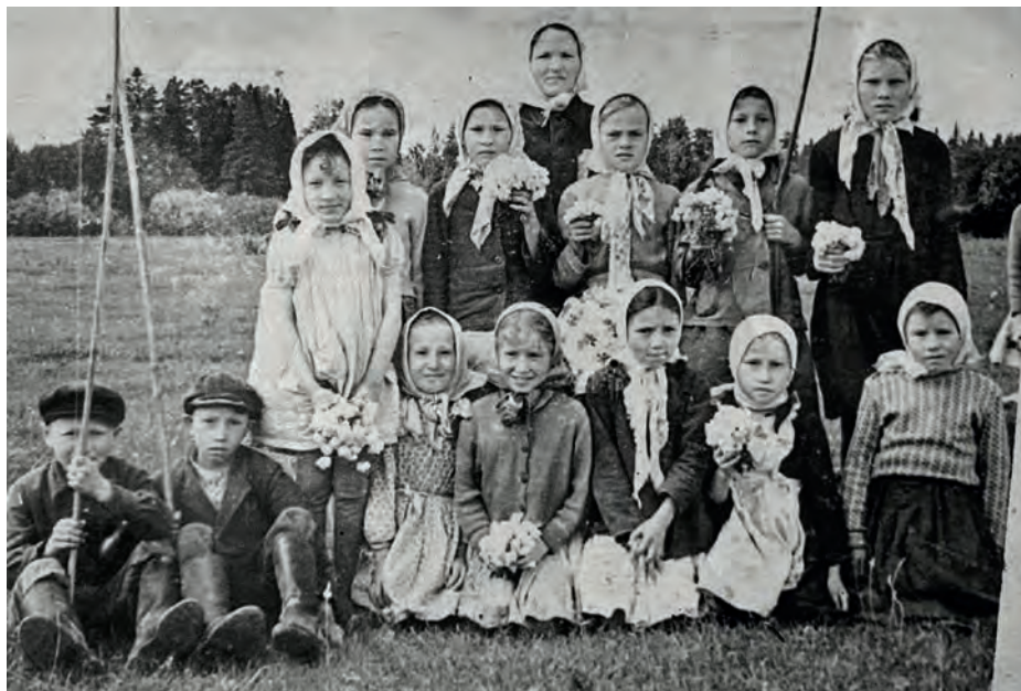
1-тй но 3-тй классын дышетскиёсын дышетскон ар бырем бере Горд яр вадьсысь возьвылын. 1962-тй ар. Вьль Тйгырмен.