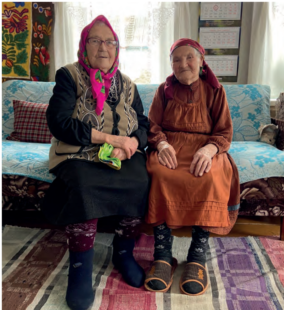
Бигер эшениз, кудйзлэсь бигер кылээ но бигер кырзангёсты дышетэ. 2023-тй ар. Выль Тйгырмен.