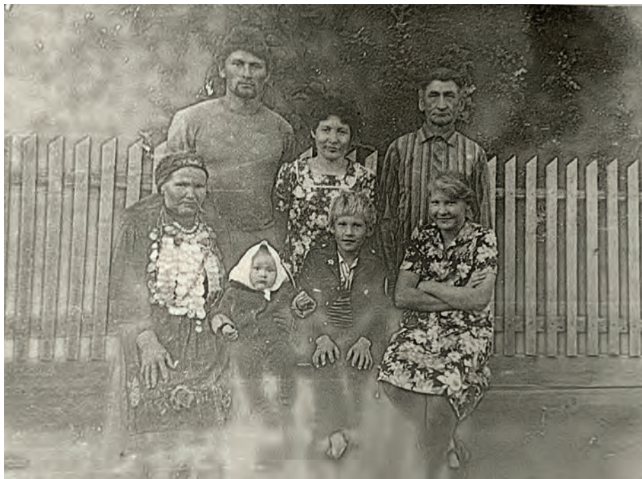
Семьяныз чош. 1983-тй ар. Вьль Тйгырмен. Никоновъёслэн архивысьтызы.