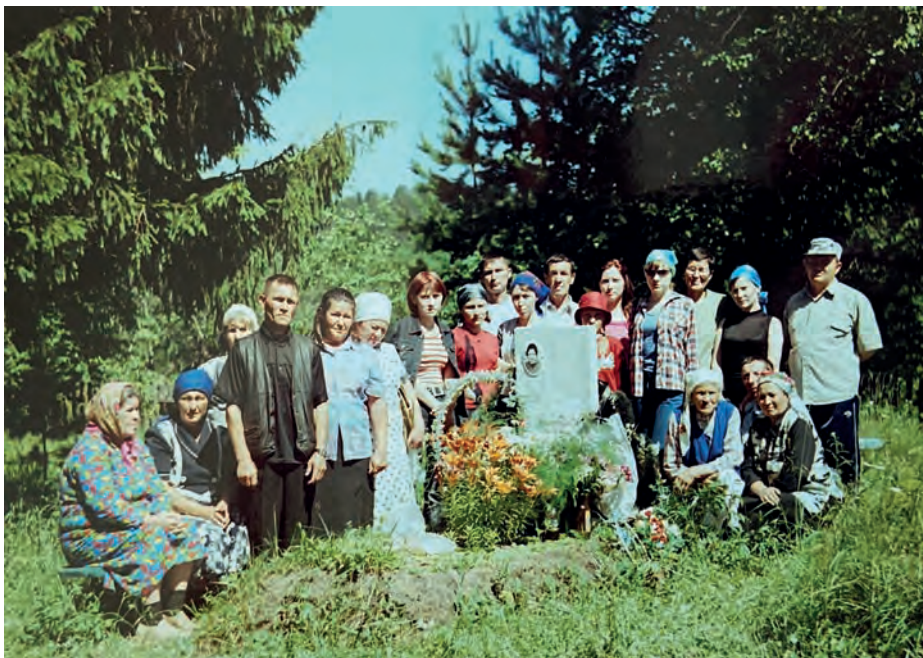
Алёна нунокезлэн шайгу вылаз 40 уяз. 2003-тй ар. Виль Тйгырмен. Никоновъёслэн архивысьтызы.