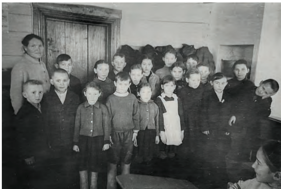
1-тй но 3-тй классын дышетскисьёсын Вьль Тйгырмен покчиёзо школаын. 1973-тй ар. Вьль Тйгырмен.