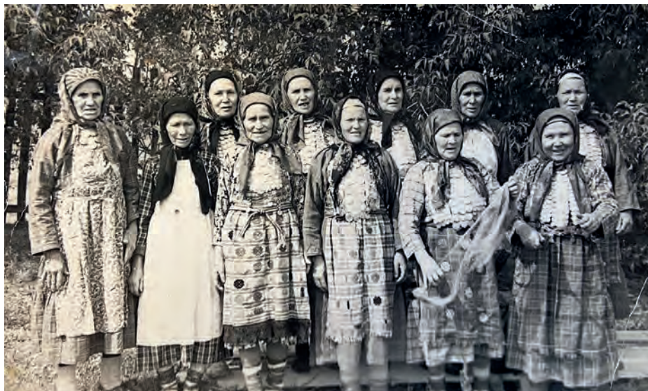
Вьль Тйгырмен гуртись кырзась-верась пересъёсын. 1975-тй ар. Вьль Тйгырмен. Никоновъёслэн архивысьтызы.