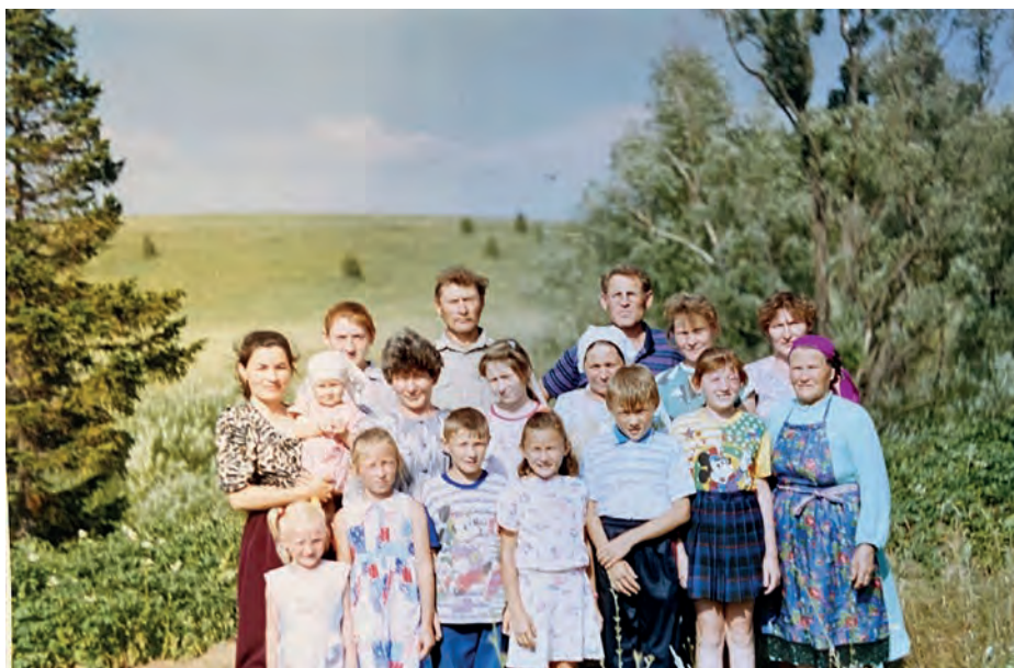
Нылпиосыныз но нунокъёсыныз бакчяз. 1998-тй ар. Виль Тйгырмен.