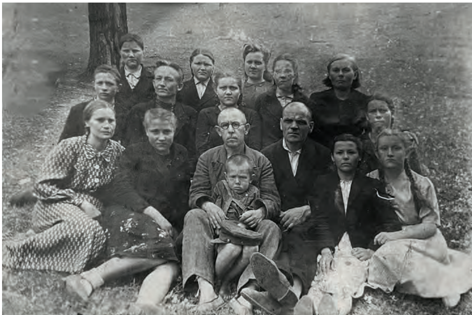
Голюшурма шор ёзо школаысь 9-тй классэз йылпумъям бере. Дышеткисьёсын но дышетисьёсын чош. 1945-тй ар. Голюшурма, Алнаш ёрос. Никоновёслэн архивысьтызы.