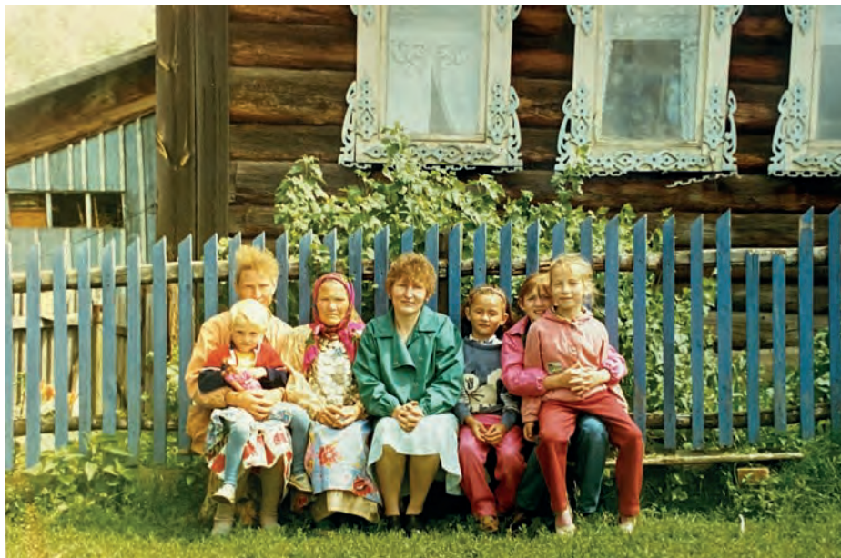
Нылъёсыныз но нунокъёсыныз ёш корка аяз. 1997-тй ар. Виль Тйгырмен. Никонвёслэн архивыстызы.