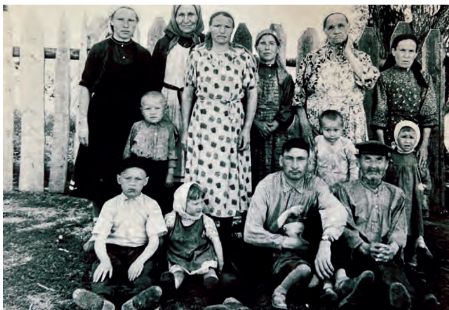
Семьяеныз но Чыжы-выжыосыныз Чош Кузёбайын маёвка (гырон быдтон) нуналэ, кунояськыны ветлыкузы. 1962-тй ар. Кузёбай, Алнаш ёрос.