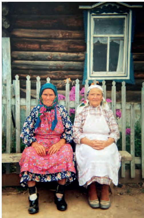
Офнасья апаеныз ёош. 2001-тй ар. Вьль Тйгырмен. Никоновёслэн архивысьтызы.