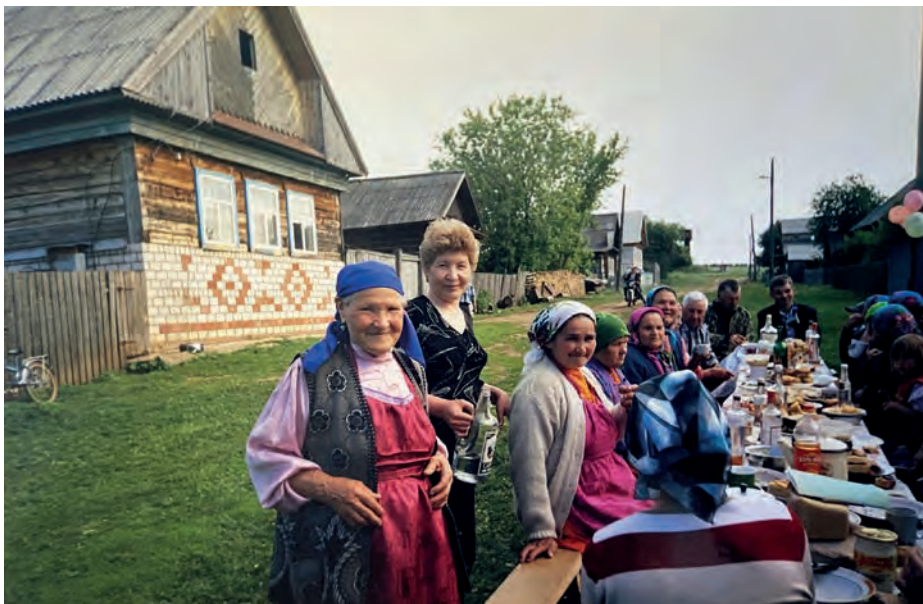
Виль урамлэн 50 ар тырмонээзлы сйзем ужрад. 2006-тй ар. Виль Тйгырмен. Никоновъёслэн архивысьтызы.