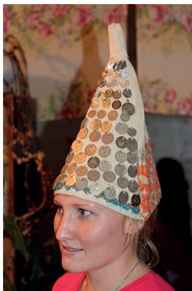
Лена нунокез Мария Павловнаен лэсьгэм айшонэн. 2013-тй ар. Вьль Тйгырмен.