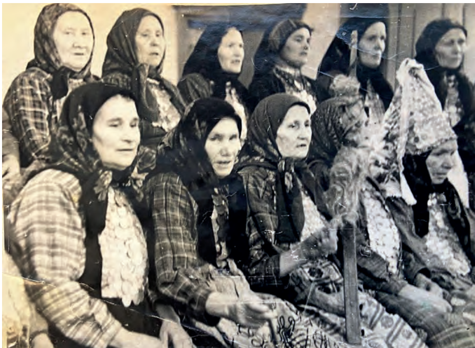
Вьль Тйгырмен гуртысь кырзась-верась пересьёсын. 1975-тй ар. Вьль Тйгырмен.