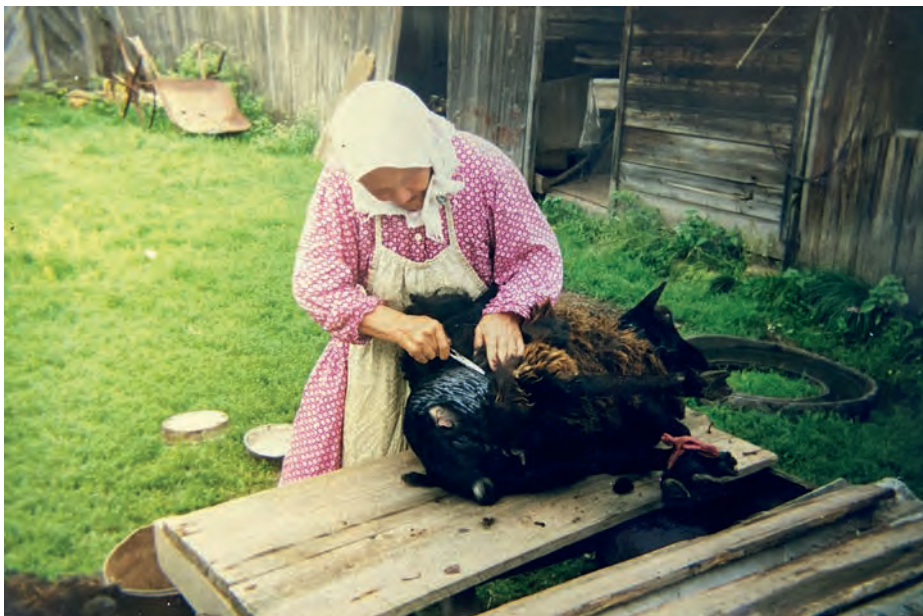
Ыж чышкон. 2000-тй ар. Вьль Тйгырмен. Никонувёслэн архивысьтызы.