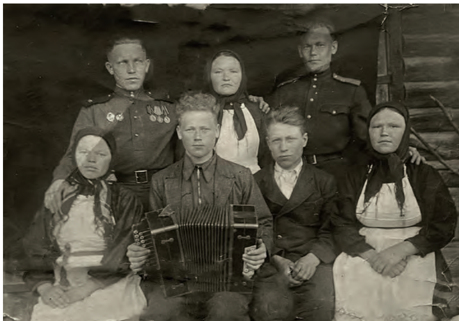
Эшъёсын но армиясь адзиськыны бертэм солдатъёсын чош. 1948-тй ар. Неннюк (Нижняя Малая Салья, Кияса ёрос). Никоновъёслэн архивысьтызы.