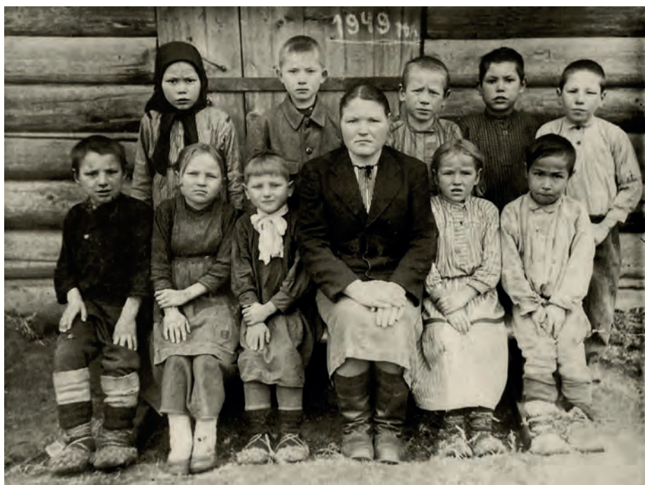
1-ти классын дышетскисьёсын Вуж Тйгырмен школа азын. 1949-ти ар. Вуж Тйгырмен. Никонувёслэн архивыстызы.