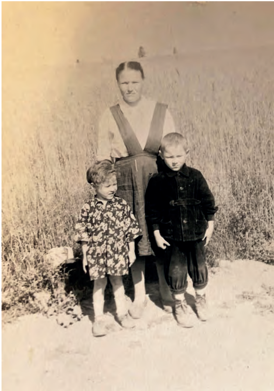
Володя но Роза нылпиосыныз бусы дурын. 1958-тй ар. Виль Тйгырмен.