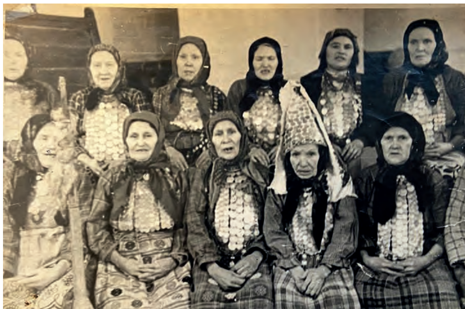
Вьль Тйгырмен гуртись кырзась-верась пересъёсын. 1975-тй ар. Вьль Тйгырмен.