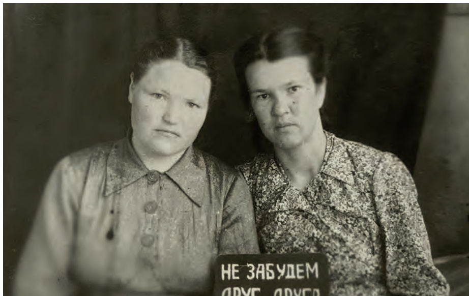
Вуж Салья гуртысь Сюкась Палаен Ижкарысь педучилищын заочно дышетскон арьёсы. 1951-тй ар. Ижкар.