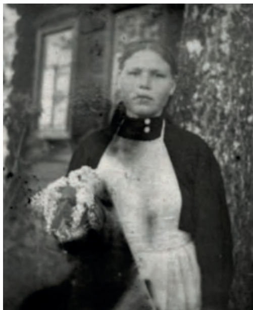
Лукерья апаез. 1953-тй арёс. Никоновёслэн архивысьтызы.