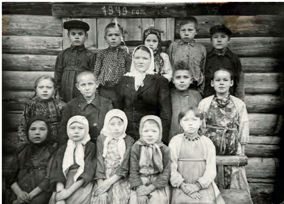
2-тй классын дышеткисьёсын Вуж Тйгырмен школа азын. 1949-тй ар. Вуж Тйгырмен.