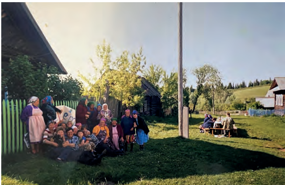
Виль урамлэн 50 ар тырмонээзлы сйзем ужрад. 2006-тй ар. Виль Тйгырмен.