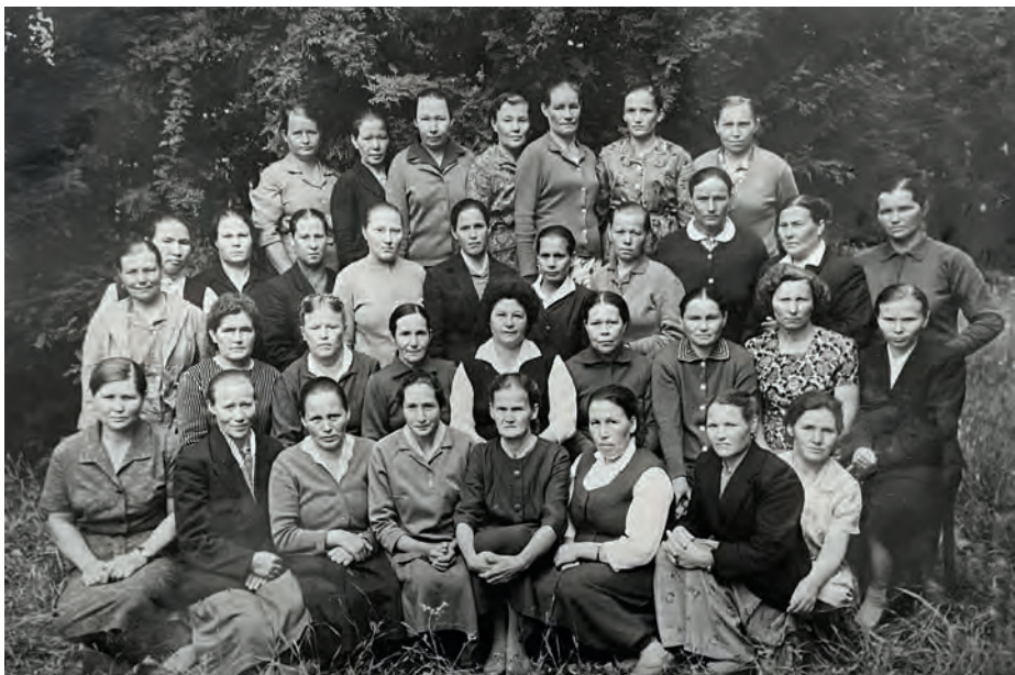
Можгалан дышетӱсьӱлы усовершенствование курсӱӱс нуон дырӱя. 1966-тӱ ар. Можга кар. Никоновӱӱслӱн архивысьтызы.