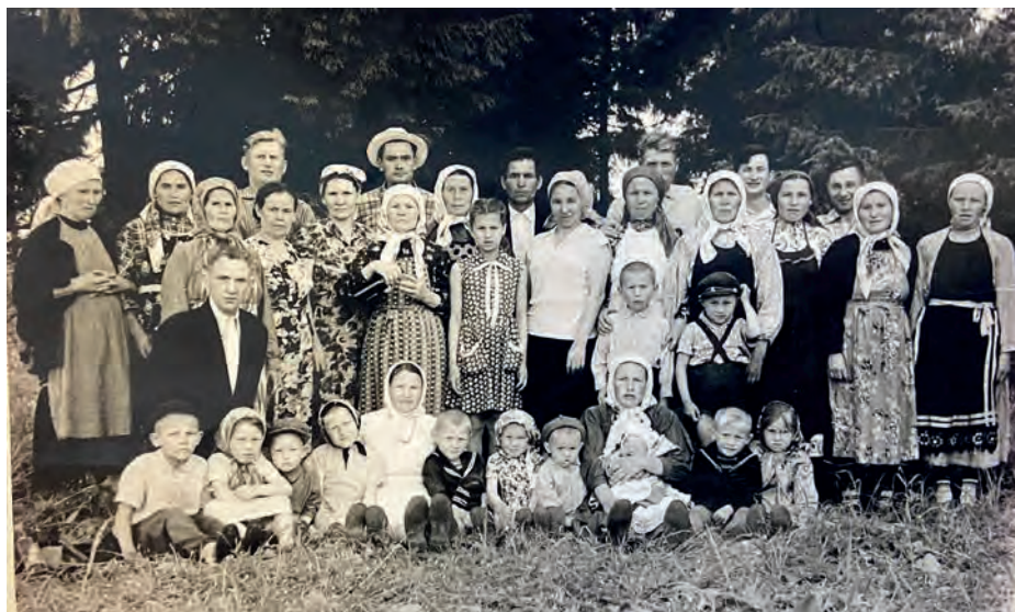
Гурто калыкен маёвка (гырон быдтон) юмшан дыръя. 1965-тй ар. Виль Тйгырмен. Никоновъёслэн архивысьтызы.