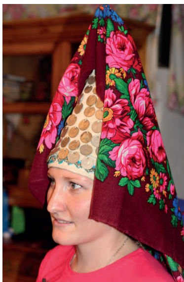
Лена нунокез айшон вьлэ понэм кышетэн, кудйз возматэ сюлыкез. 2013-тй ар. Вьль Тйгырмен.