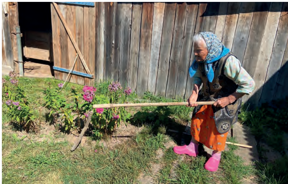
Мария Павловна возматэ, кызы азьвыл арёсы қутсаськызы. 2022-тй ар. Вьль Тйгырмен.