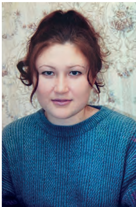
Дырызлэсь вазь улоньсь кошкем Алена нунокез. Никоновъёслэн архивысьтызы.