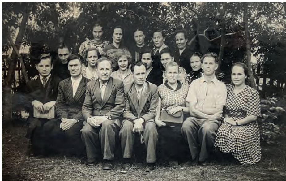
Можгалась педучилищын дышетскон аръёсы. 1956-тй ар. Можга кар. Никоновъёслэн архивысьтызы.