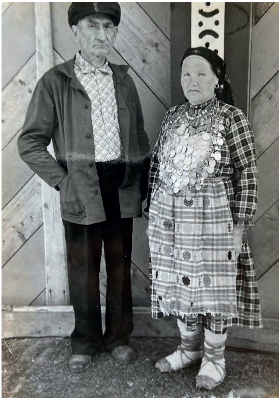
Виктор кузпалэныз. Сарапульсь шаертонъя музейысь ужасьёс ветлыку лэсьтэм туспуктэм. 1986-тй ар. Вьль Тйгырмен. Никоновъёслэн архивысьтызы.