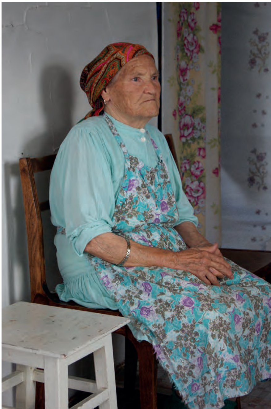
Мур малпаськонын. Вьль Тйгырмен.