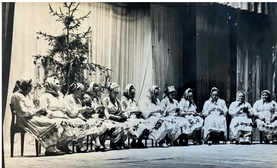
Киясаысь ёрос сцена вылын Выль Тйгырмен гуртысь кырзась-верась кышноосын. 1991-тй аръёс. Кияса.