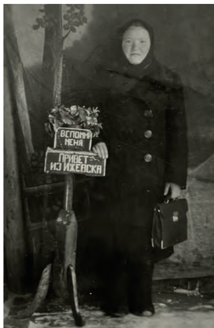
Ижгарысь педучилищын заочно дышетскон аръёсы. 1951-тй ар. Ижгар. Никоновёслэн архивысьтызы.