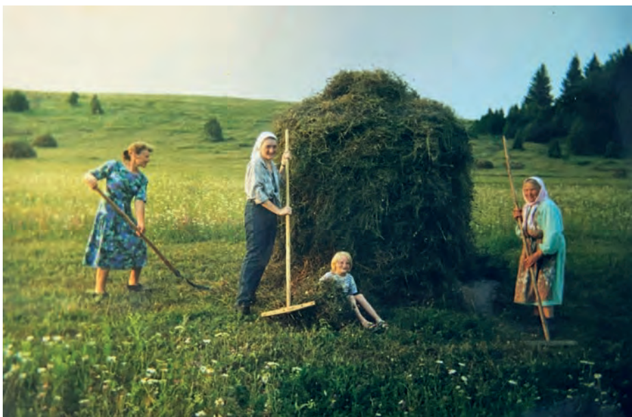
Эркемей шур дурьсь возь вылын турын дасян. 2000-тй ар. Вьль Тйгырмен.