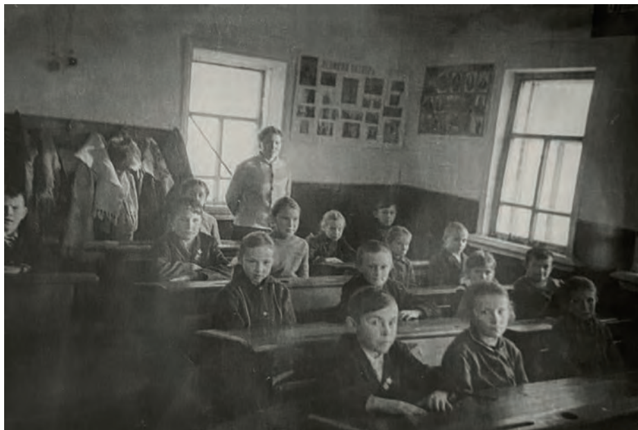
1-тй но 3-тй классын дышетскиёсын Вьль Тйгырмен покчиёзо школаын. 1973-тй ар. Вьль Тйгырмен. Никоновъёслэн архивысьтызы.