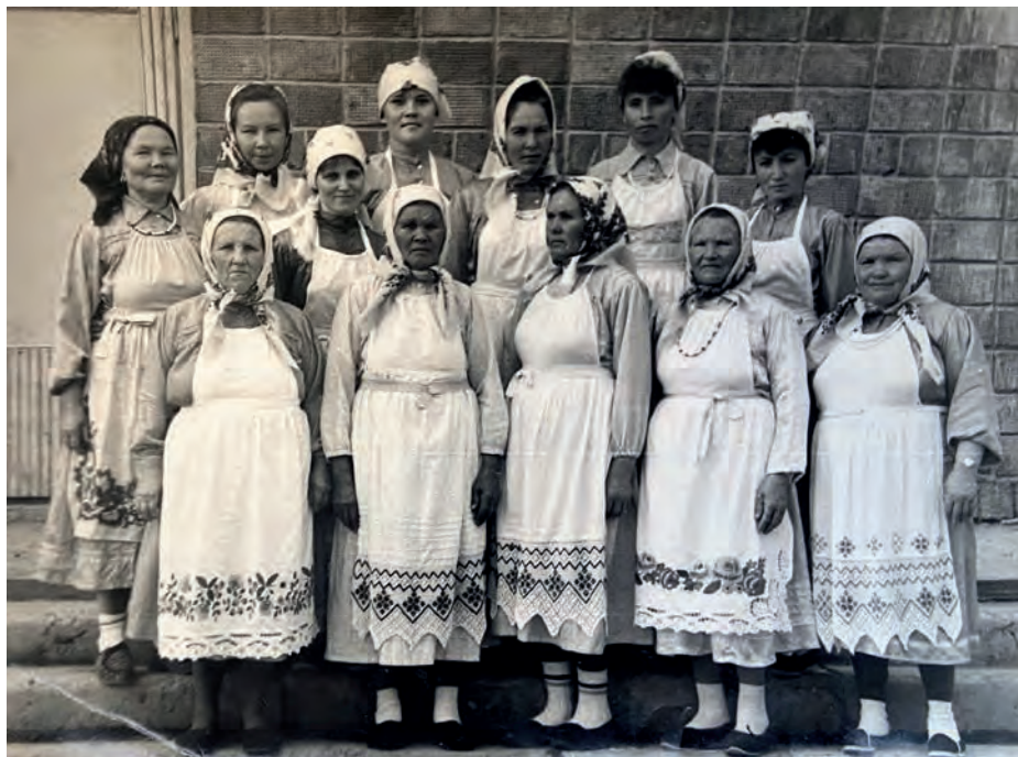
Выль Тйгырмен гуртысь кырзась-верась кышноосын. 1993-тй ар. Выль Тйгырмен.