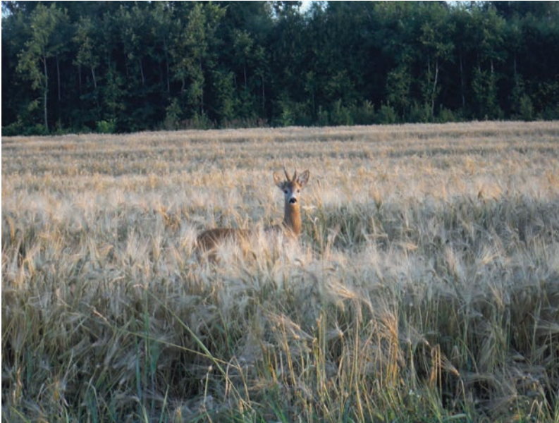
Foto 2. Metskitsesokk. Ilmatsalu. Maila Jürgensoni foto. ERA, DF 48176.

Nende vaatlustel põhinevad lood sisaldasid informatsiooni loomade käitumisest, anatoomiast ja elupaikadest. Jutustati juhtudest, kui jahisaak saadi ebatavalisel viisil või jäi pärast pikka jahilkäiku üldse saamata, ning kordadest, mil ainult kuuldi metsloomi häält tegemas või nähti nende jälgi lumises metsas.